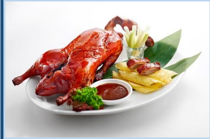
TXINA Ahate pekindar erara

Elgoibarren jasotako beste plater batzuk: