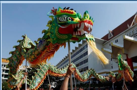
Urte Berri txinatarra