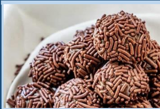
BRASIL Brigadeiro bonboiak