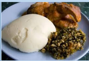
KONGO Fufu 1 eta 2