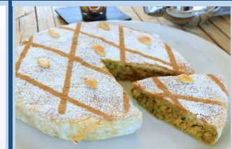
MAROKO Pastela eta cous-cousa