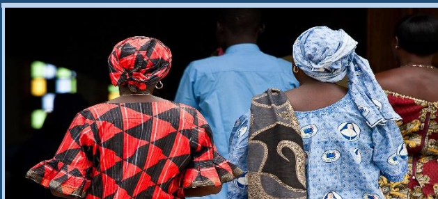
Senegal: 1 eta 2