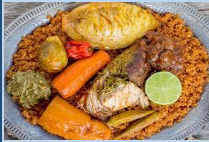
SENEGAL Thieboudienne 1 eta 2