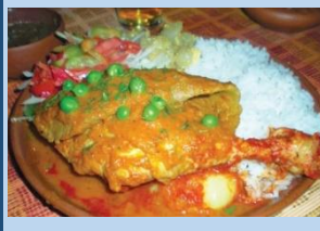
BOLIVIA Picante de pollo