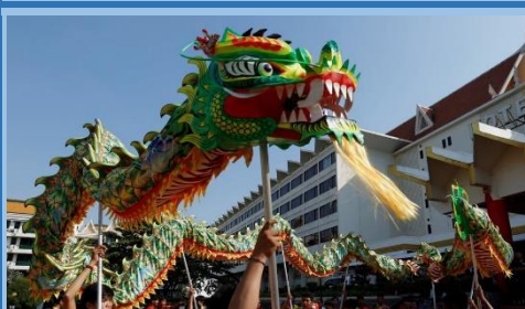
Urte Berri Txinatarra