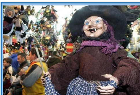
Gabonak Italian: Befana