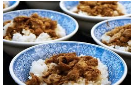
Katiluak plateren orde