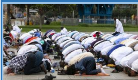
Arkumearen festa: 1 eta 2