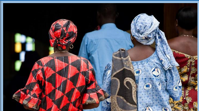
Senegal: 1 eta 2