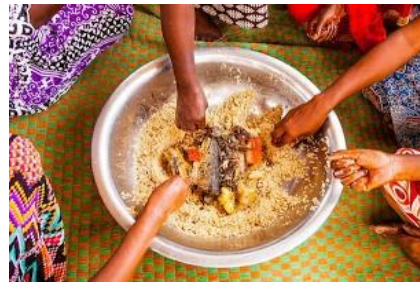
Plater bakarretik jatea